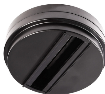
710513 Grafit-schwarz graphite black

maximale Belastbarkeit 10 kg (100 N) / maximum load 10 kg (100 N) 220-250V/10AAC