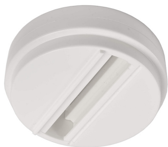
710512 Verkehrsweiß traffic white

Schienensystem 3-Phasen 230V mit Dali-Steuerung, D Line DALI- Aufbau-Adapter für Leuchten / Track system 3-Phases 230V with Dali-control, D Line DALI mounting adapter for lights