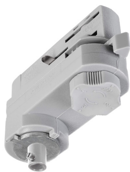
710098 Fenstergrau window grey