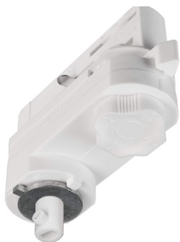
710097 Verkehrsweiß traffic white

IMPORTANT: Never move an already installed track adapter within the track while it is under voltage, as this may damage the connected luminaire.