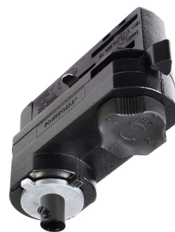
710099 Grafit schwarz graphite black

maximale Belastbarkeit 10 kg (100 N) / maximum load 10 kg (100 N) 220-250V/10AAC